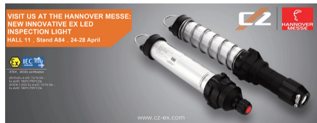
图：ATEX欧盟防爆认证，IECEX国际防爆认证新型LED防爆检修灯CZ1260将于2017汉诺威展隆重亮相

汉诺威工业博览会（HANNOVER MESSE）始创于1947年8月，是当今规模最大的国际工业盛会，被认为是联系全世界技术领域和商业领域的重要国际活动，不仅是世界上展出面积最大的工业展，而且展品展示技术含量非常之高，是联系全球工业设计、加工制造、技术应用和国际贸易的最重要的平台之一。“工业4.0”一词最早就是在2011年汉诺威工业博览会上出现的。发展至今，该展已无可厚非地称之为“全球工业贸易领域的旗舰展”和“最具影响力涉及工业产品及技术最广泛的国际性工业贸易展览会”。