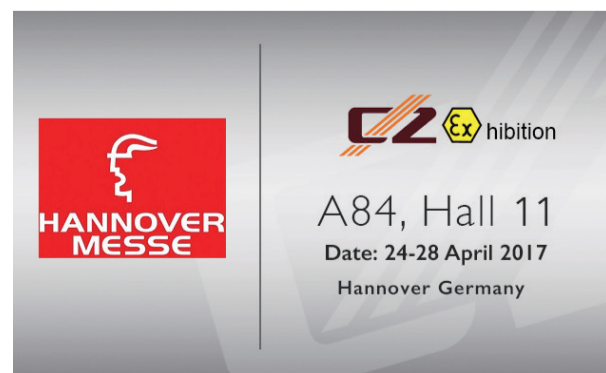
2017汉诺威工业博览会将于4月24-28日在德国汉诺威展览中心举行，创正展台位于A84-11。

现如今，工业4.0席卷全球经济，影响着各行各业，作为中国塑料防爆电器的第一品牌，创正防爆致力于为防爆领域提供性能安全卓越的产品，志在全球防爆用户，实现更节能，更环保，更安全。（破风）